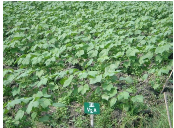
Gambar Lampiran 2. Tanaman kapas berumur 45 hari