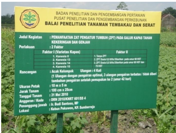
Gambar Lampiran 1. Kondisi tanaman pada percobaan zat pengatur tumbuh (paclobutrazol)