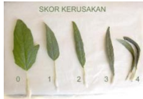
Gambar 1. Skor kerusakan daun wijen oleh P. latus .

Skor 0 = sehat 1 = 1–25% terserang sebagian 2 = 26–50% keriting sebagian hingga setengah 3 = 51–75% keriting hampir semua 4 = 76–100% keriting hingga daun melengkung